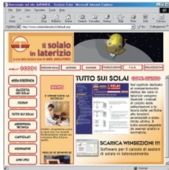
1. La main page di www.solaioinlaterizio.it .

Un sito web dedicato integralmente ad un sistema costruttivo, con profonde radici nel tessuto edilizio nazionale, il solaio in laterizio appunto, con soluzioni progettuali, programmi di calcolo, dettagli esecutivi, normative di riferimento, servizi informativi e assistenza tecnica basati su competenza ed esperienza qualificate