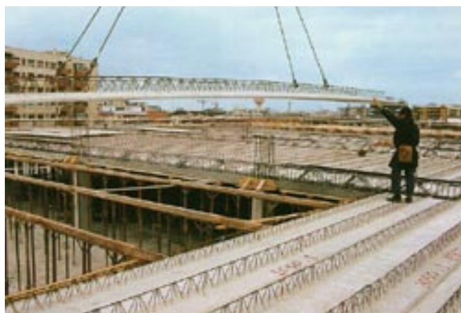
Posa delle lastre precomprese da 10,50 m a due tralicci.