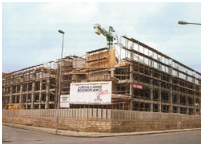
Vista del cantiere in fase di avanzata realizzazione.

L'impiego di pannelli precompressi ha consentito, inoltre, nel rispetto delle norme vigenti, ed in particolare della Legge 1086, di contenere lo spessore degli orizzontamenti in 38 cm, rispettando le altezze di progetto degli interpiani. L'alleggerimento dei solai si è ottenuto con il posizionamento in opera di blocchi in laterizio delimitanti le nervature di getto in opera. La facilità di montaggio delle lastre precomprese e degli elementi in laterizio, nonché la potenzialità produttiva e l'organizzazione delle consegne, hanno consentito un agevole avanzamento delle opere di cantiere.