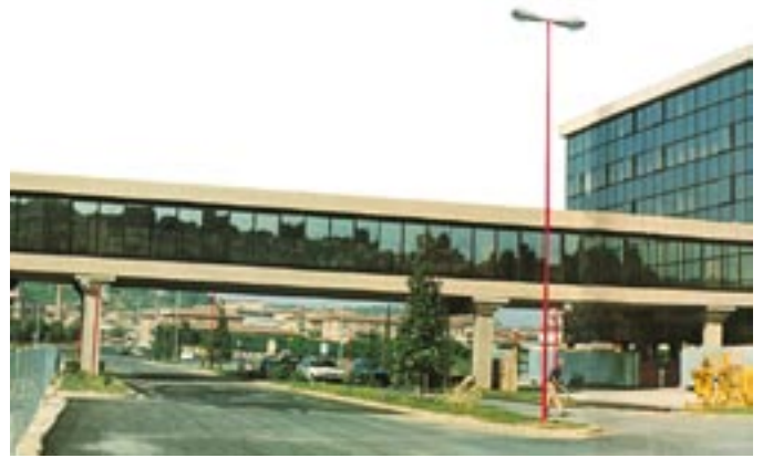
L'edificio a "ponte" finito.

In conclusione, l'adozione di un solaio a lastre nervate in cemento armato precompresso e blocchi in laterizio ha consentito di realizzare campate di notevole luce con minimo ingombro di impalcatura. Le caratteristiche delle lastre, prefinite all'intradosso, hanno inoltre sensibilmente ridotto le operazioni di completamento.