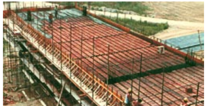
Una fase costruttiva delle campate di luce 19 e 13,50 metri.